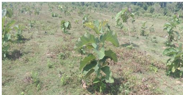
රූපය 2:5 ගොවි වන වගාවන් සඳහා තේක්ක පැළ සිටුවීම

2021 වර්ෂය තුළ ගොවි වන වගා හෙක්ටයාර් 92ක්, හම්බන්තොට, අම්පාර, අනුරාධපුර, මඩකලපුව, පුත්තලම, පොළොන්නරුව, මාතලේ හා මොණරාගල දිස්ත්‍රික්කවල ස්ථාපනය කරන ලදී. මෙම ගොවි වන වගාවන්හි සිටුවීම සඳහා තේක්ක පැළ 92,900ක් නිපදවා ඇති අතර ගොවීන් 188 දෙනෙකු සහභාගි කරවා ඇත. එමෙන්ම 2019 වර්ෂය තුළ ස්ථාපනය කරන ලද ගොවි වන වගා හෙක්ටයාර් 80ක් ද, 2020 වර්ෂය තුළ ස්ථාපනය කරන ලද ගොවි වන වගා හෙක්ටයාර් 90ක් ද විද්‍යාත්මකව කළමනාකරණය කරන ලදී.