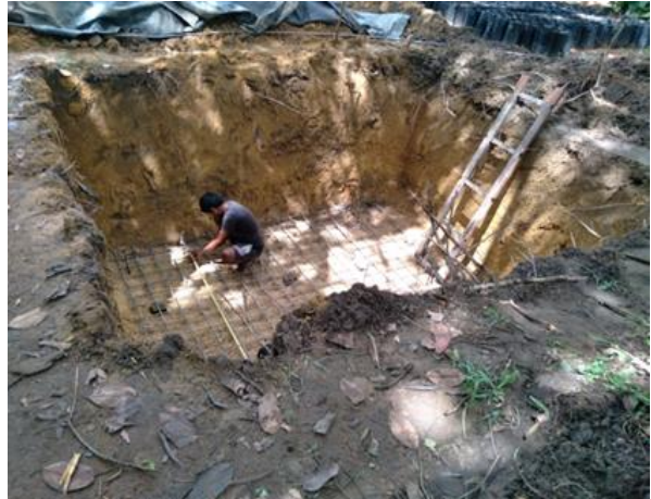
රූපය 2:4 තවත් සංවර්ධනය කිරීම