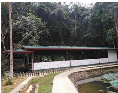
රූපය 2:8 කන්තෙලිය දේශන ශාලාව

වන සංරක්ෂණ දෙපාර්තමේන්තුව මගින් පාලනය වන පාරිසරික සංචාරක ගමනාන්ත වල දේශීය හා විදේශීය සංචාරකයින් සඳහා වන යටිතල පහසුකම් හා සේවා වැඩි දියුණු කිරීමට 2021 වර්ෂයේ පාරිසරික ගමනාන්ත 12ක හා කඳවුරු භූමි 03ක නඩත්තු කටයුතු හා සංවර්ධන කටයුතු සිදු කරන ලදී. ඒ අනුව ස්වභාවික මංපෙත් නඩත්තුව, සිංහරාජයේ කුරුළු නැරඹුම් මැදිරියක් ඉදිකිරීම, බලංගොඩ හිරිකටු ඔය කඳවුරු භූමියේ කඳවුරු කුඩාරමක් ඉදිකිරීම, තුඹතැන්න අධ්‍යාපන හා තොරතුරු මධ්‍යස්ථානය වැඩිදියුණු කිරීම, කන්තෙලිය දේශන ශාලාව අලුත්වැඩියා කිරීම, පිටදෙනිය සිංහරාජ සංරක්ෂණ මධ්‍යස්ථානයේ ප්‍රවේශ මාර්ගය වැඩි දියුණු කිරීම, බදුල්ල ඇල්ලගල කඳවුරු භූමියේ කඳවුරු කුඩාරමක් ඉදිකර ජල පහසුකම් සැපයීම හා වැසිකිලි පද්ධතිය සංවර්ධනය කිරීම, අම්පාර නුවරගල පාරිසරික සංචාරක කලාපයේ පොල්ලේ බැද්ද පිවිසුමේ ප්‍රවේශ පත්‍ර කළුව ව ඉදි කිරීම, පොලොන්නරුව දිසාවේ ගල් ඔය පාරිසරික උද්‍යානය සඳහා ප්‍රවේශපත්‍ර කළුව ව ඉදිකිරීම වැනි ප්‍රධාන සංචාරක යටිතල පහසුකම් හා සංවර්ධන කටයුතු ඉටු කරන ලදී.