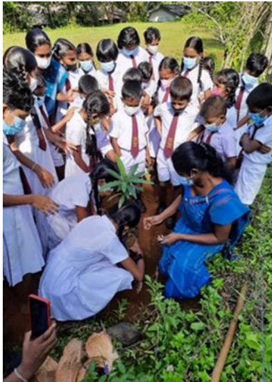
රූපය 2:1 වන රෝපණ වැඩසටහන්

පරිසර සංරක්ෂණය, ජල පෝෂක ප්‍රදේශ සංරක්ෂණය, ජෛව විවිධත්වය සංරක්ෂණයෙහිලා පාසල් සිසුන් හා ප්‍රජාව නැඹුරු කිරීමේ හා ප්‍රවර්ධනය කිරීමේ අරමුණින් දීප ව්‍යාප්තව දැනුවත් කිරීමේ වැඩසටහන්, වැඩමුළු, ගිනි කළමනාකරණ වැඩසටහන්, ප්‍රදර්ශන, ශ්‍රමදාන, ක්ෂේත්‍ර වාරිකා, පරිසර කඳවුරු, තරඟ හා වෙනත් විශේෂ වැඩසටහන් 770ක් පවත්වන ලද අතර පාසල් හා ප්‍රජා සහභාගිත්වයෙන්, මාර්ග දෙපස, ජලාධාර අවට හා ගං ඉවුරුවල මෙන්ම, පාසැල් හා රාජ්‍ය ආයතන භූමිවල, ආගමික සිද්ධස්ථාන මෙන්ම වෙනත් ස්ථානවල රුක්රෝපණ වැඩසටහන් 798 ක් ක්‍රියාත්මක කරන ලදී.