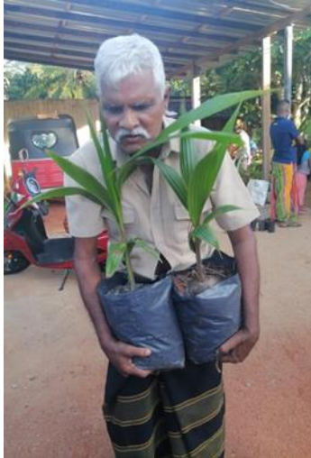
රූපය 2:6 ගෙවතු සංවර්ධන වැඩසටහන්