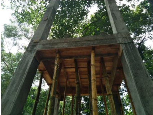
රූපය 2:3 තවත් සංවර්ධනය කිරීම

විශේෂ වන වගා ව්‍යාපෘතිය යටතේ 2021 වර්ෂය තුළ දිසාවන් 19ක් තුළ පිහිටි දෙපාර්තමේන්තු පැළ තවත් 29ක් සංවර්ධනය කරන ලදී. එහි දී තවත් භූමි සැකසීම, තවත් ප්‍රවේශ මාර්ග පිළිසකර කිරීම, තවත් වැට සකස් කිරීම, ජල නල පද්ධති අලුත්වැඩියාව හා විසිරුම් ජල සම්පාදන පද්ධති සැකසීම, ජල ටැංකි හා ජල ටැංකි කුළුණු ස්ථාපනය කිරීම, මව් පාත්ති ස්ථාපනය, සෙවණ ගෘහ ඉදි කිරීම, හරිත ගෘහ තැනීම හා අලුත්වැඩියාව, තවත් වටා අලිවැට ඉදිකිරීම් වැනි ක්‍රියාකාරකම් රැසක් සිදුකර ඇත.