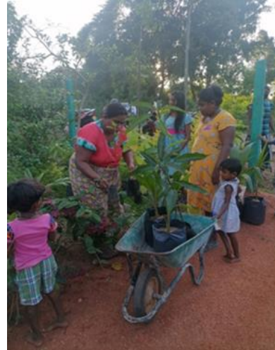
රූපය 2:7 ගෙවතු සංවර්ධන වැඩසටහන්