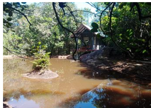
රූපය 2:9 සිංහරාජය කුඩව-විහගකැදැල්ල කුරුළු නැරඹුම් මැදිරිය