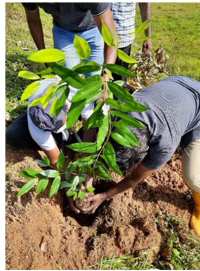
රූපය 2:2 වන රෝපණ වැඩසටහන්