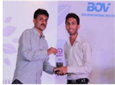
LAN සහාය ලබාදීමට ප්‍රතිඥා දෙමින් LAN ආයෝජකයෙකු වෙතින් සැකි ලතින් කුසලාන ලබමින්