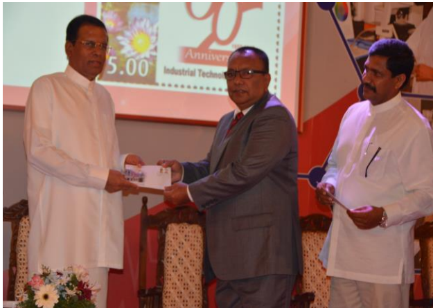
Participating in a Stamp Issue H.E. the President with Hon. Minister and Hon. Deputy Minister