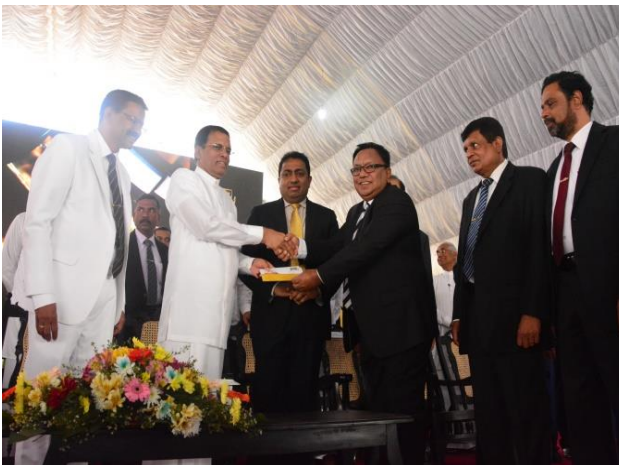
Issuing First Day Covers for D. S. Senanayake and St. Pauls Collages