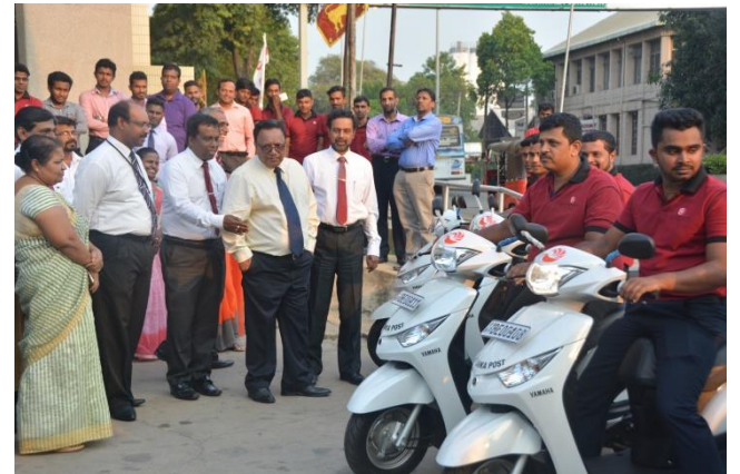
Distribution of new motor bicycles in order to upgrade Speed Post