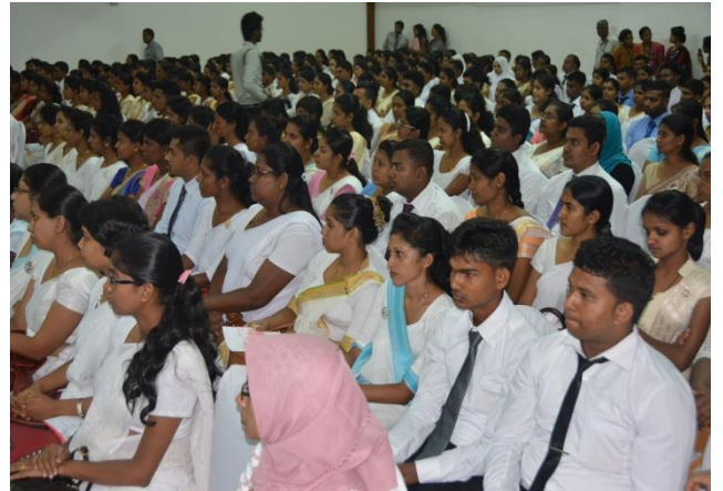
New recruitment of Postal Services officers on 11.07.2016