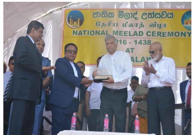
Participating in a Meelad Ceremony Hon. Prime Minister with Hon. Minister and Secretary