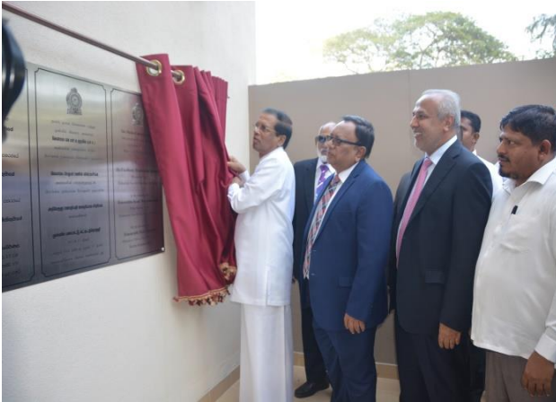
Inaugural Ceremony of the New Building for Department of Muslim Religious and Cultural Affairs