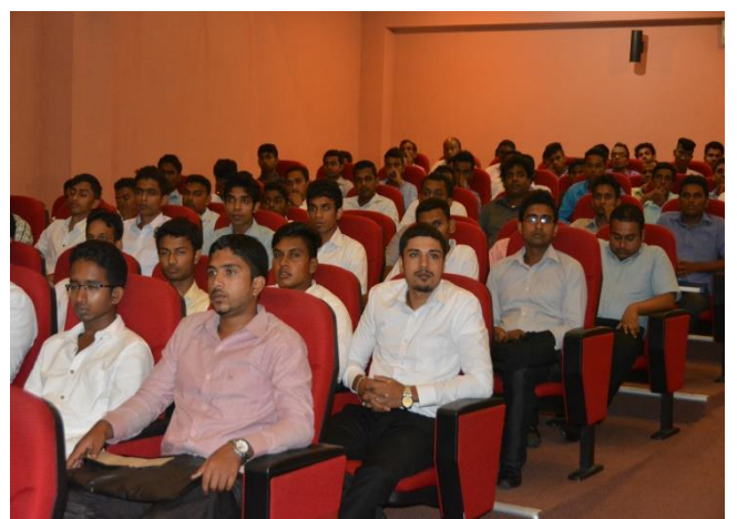
New recruitment of Postal Substitutes on 20.07.2016