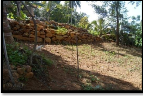
மாத்தறை மாவட்டம் - பஸ்கொட பிரதேச செயலாளர் பிரிவு