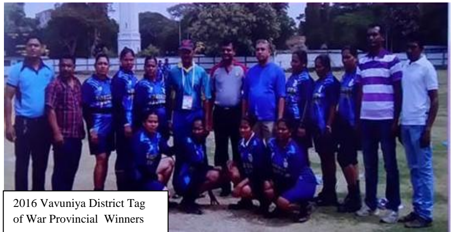
2016 Vavuniya District Tag of War Provincial Winners