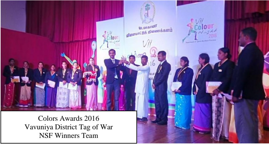
Colors Awards 2016 Vavuniya District Tag of War NSF Winners Team