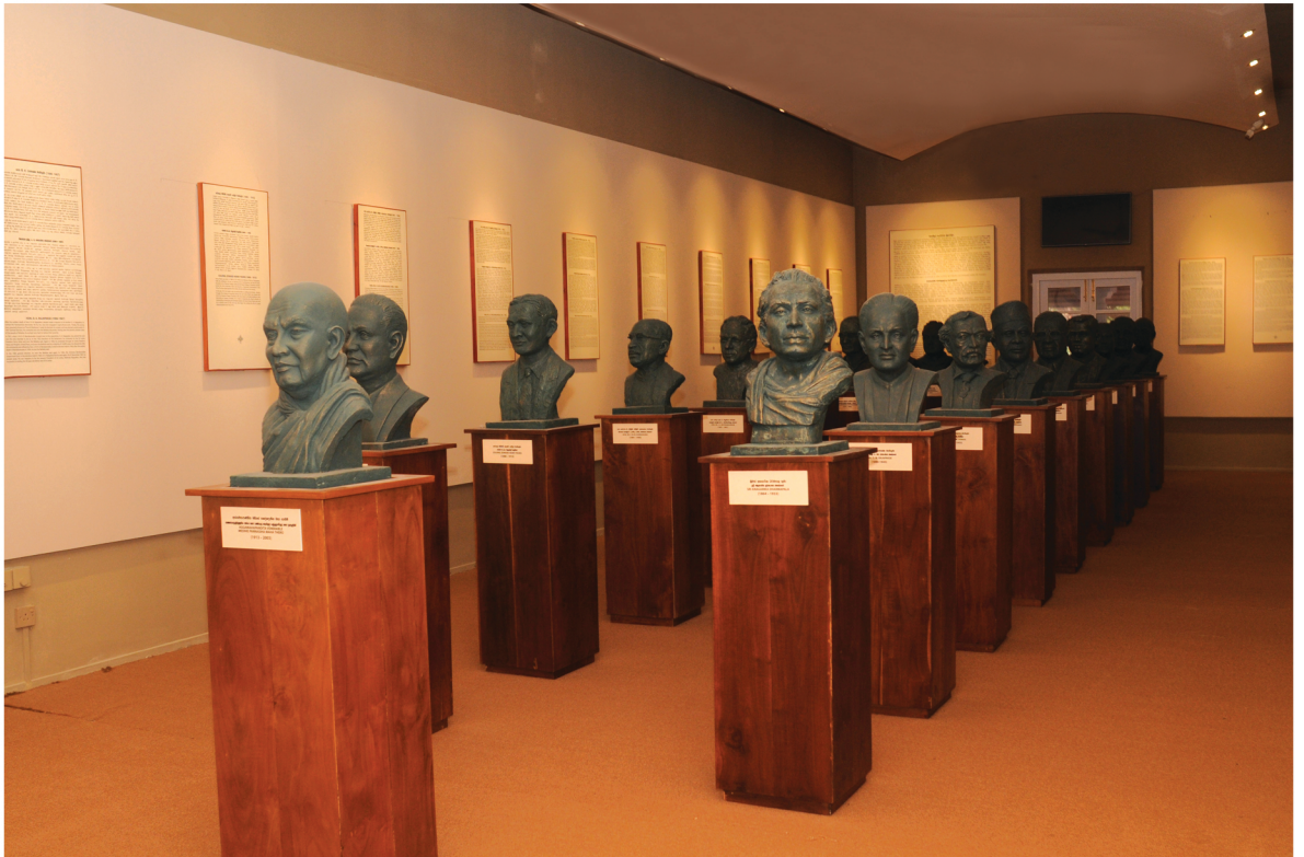
ජායාරූපය - අංක 02