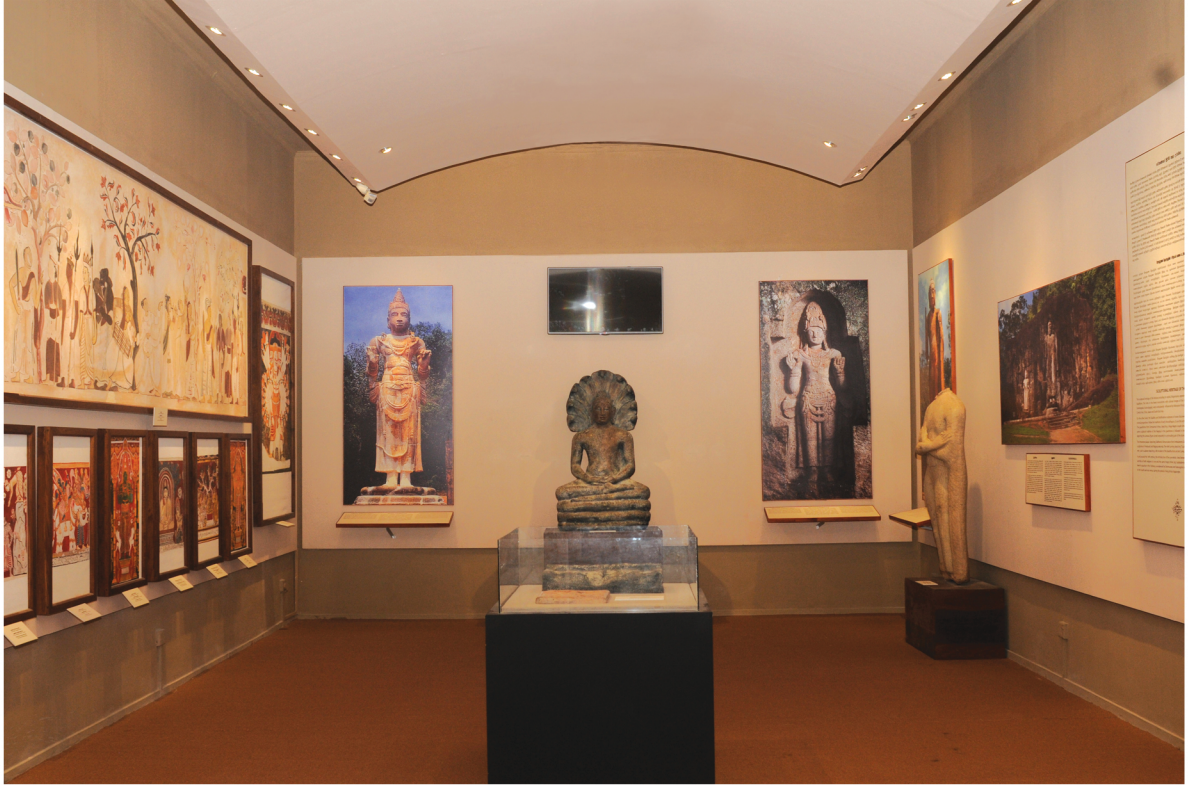
ජායාරූපය - අංක 01