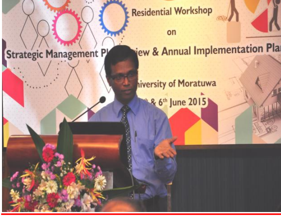
உபாய முகாமைத்துவ திட்ட மீளாய்வு பற்றிய

மொறட்டுவைப் பல்கலைக்கழகத்தின் 2020, 2030ஆம் ஆண்டுக்கான பிரதான திட்டம் கட்டடக்கலை பீடத்தின் பணியாட்டொகுதி உறுப்பினர் குழுவொன்றினால் தயாரிக்கப்பட்டது. பல்கலைக்கழகத்தின் தற்போதைய சகல பெளதிக அபிவிருத்தி செயற்பாடுகளும் இந்த பிரதான திட்டத்திற்கும் செயல்நுணுக்க முகாமைத் திட்டத்திற்கும் (SMP) 2014-2018 ஏற்ப மேற்கொள்ளப்படுகிறது. பல்கலைக்கழகம் சார் துரித விரிவாக்கத்துடன், 2020 மற்றும் 2030