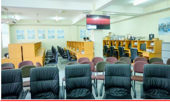
புதிய இயந்திரப் பொறியியல்

40 மில்லியனை பல்கலைக்கழகம் பெற்றுக்கொண்டது. இக் கருத்திட்டம் 2011 யூலை மாதம் ஆரம்பிக்கப்பட்டது. அத்துடன், புத்தகங்கள், கற்பிப்பதற்கான மென்பொருள் மற்றும் இலத்திரணியல் மூலவளங்கள் ஆகியவற்றைக் கொள்வனவு செய்வதற்காக HETC கருத்திட்டத்தின் கீழ் ரூ. 9.0 மில்லியன் மானியமும் பல்கலைக்கழகத்திற்கு கிடைத்ததுடன், அந் நிதி முழுமையாக பயன்படுத்தப்பட்டுள்ளது. QIG மானியத்தின் கீழ் நான்கு திணைக்களங்கள் மானியங்களைப் பெற்றுக்கொள்வதில் திறமையாகச் செயற்பட்டன - முதலாவது சுற்றில் புடைவை, ஆடைத் தொழில்நுட்பத் திணைக்களம் மற்றும் பட்டணமும் நாளும் திட்டமிடல் திணைக்களம்