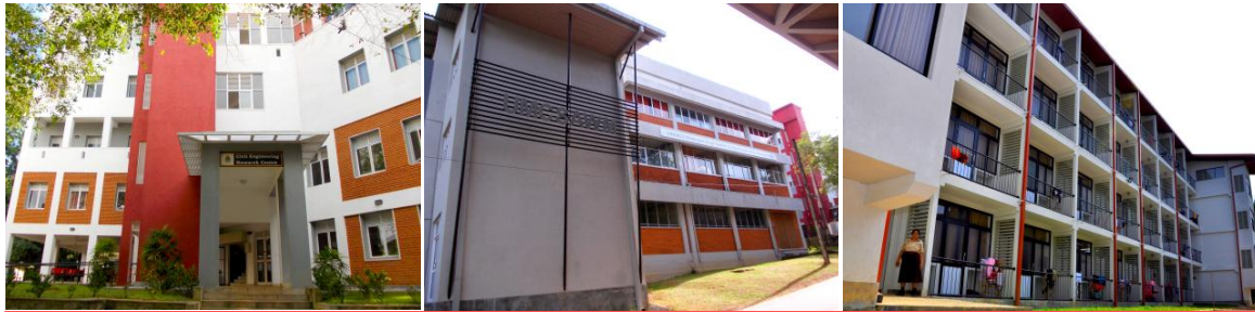
சிவில் பொறியியல் ஆய்வு நிலையம்