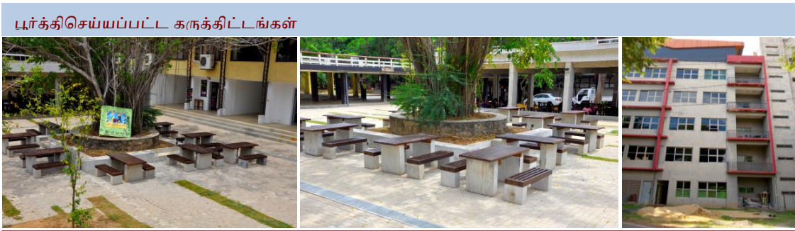
மாணவர் நிலையம் மற்றும் சிற்றுண்டிசாலை விரிவாக்கல்

என்பனவும், இரண்டாவது சுற்றில் மின்னணு, தொலைத்தொடர்பு பொறியியல் திணைக்களம் மற்றும் மின் பொறியியல் திணைக்களம் என்பனவும் ஒவ்வொன்றும் ரூ. 25 மில்லியன் பெறுமதி கொண்ட மானியத்தைப் பெற்றன. முன்மொழிவுக் கட்டப் போட்டியில் பல்கலைக்கழக அமைப்பு முழுவதிலும் அதிகபட்ச புள்ளிகளைப் பெற்று இத் திணைக்களங்கள் இப் பரிசில்களை வென்றதுடன், இரண்டாவது சுற்றில் இரு விசேட பரிசில்களையும் பெற்றுக்கொண்டன என்பதை குறிப்பிடுதல் வேண்டும்.