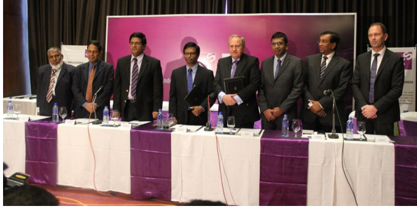
IFS நிறுவகத்துடன் புரிந்துணர்வு உடன்படிக்கை கைச்சாத்திடல்

மொறட்டுவைப் பல்கலைக்கழகமானது, மூன்று வருடங்களுக்காக தேசிய அபிவிருத்தி வங்கியின் நிதி உதவியுடன் பல்கலைக்கழக முறைமையில் முதன்முதலாக ஏற்படுத்திய கைத்தொழில் ஆதரவு தலைமைத்துவத்துடன் கூடிய “தொழிலுரிமைத்துவம் பற்றிய NDB வங்கியின் அறக்கொடையுடனான பேராசிரியர்/உறுப்பினர்” எனும் கௌரவ பதவியை உருவாக்கியுள்ளது. இதன் கீழ் முதலாவது அறக்கொடையுடனான பேராசிரியர் 2010 ஆண்டு அக்டோபரில் மாதத்தில் நியமிக்கப்பட்டதுடன்,