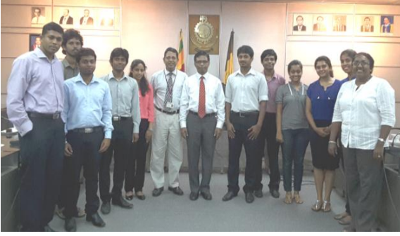
HSBC வெற்றியாளர்கள் உப வேந்தரவர்களை

(Massachusetts Institute of Technology (MIT) - USA) பட்டமேற்படிப்பு பட்டத்தை கற்பதற்கான அனுமதியை பெற்றுக் கொண்டார்.