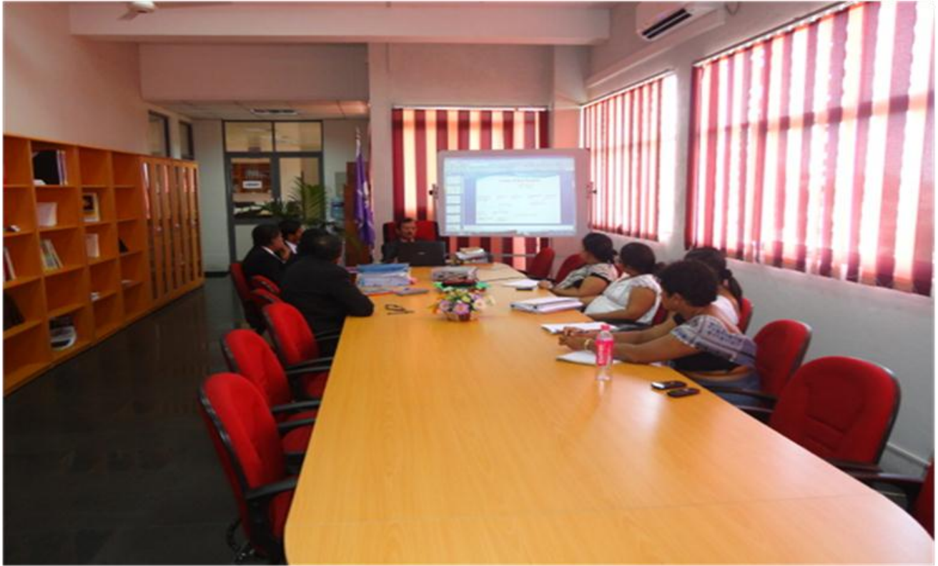
ශ්‍රී ලංකා විනිශ්චයකාරවරයන්ගේ ආයතනයේ ශ්‍රවණාගාරය