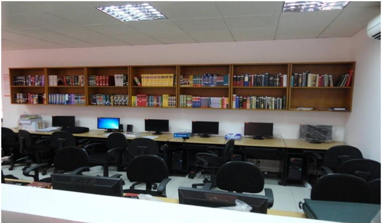
ශ්‍රී ලංකා විනිශ්චයකාරවරයන්ගේ ආයතනයේ පරිගණක විද්‍යාගාරය