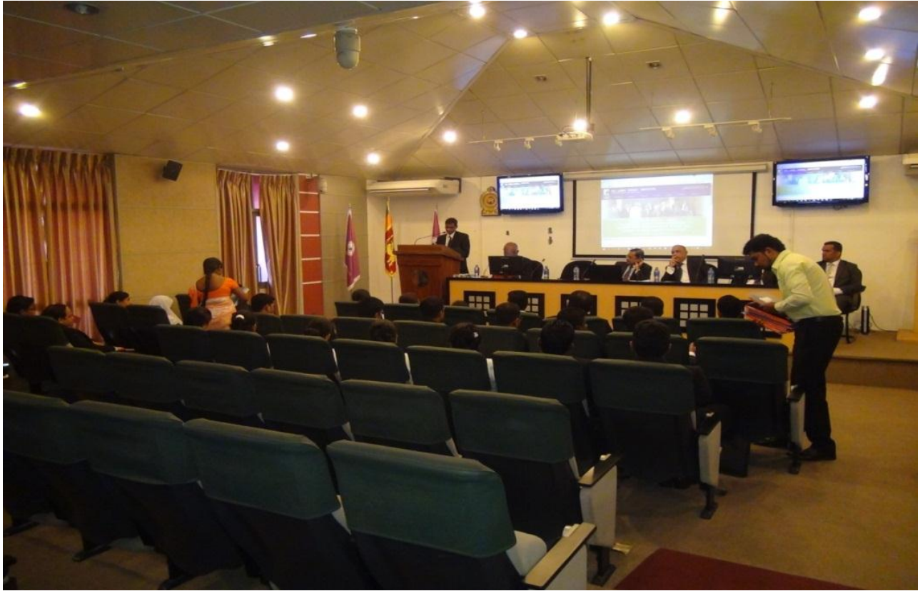
ශ්‍රී ලංකා විනිශ්චයකාරවරයන්ගේ ආයතනයේ ශ්‍රවණාගාරය