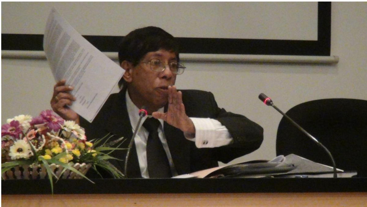
අලුතෙන් බඳවාගන්නා ලද අධිකරණ නිලධාරීන් සඳහා ගරු විනිසුරු පී.එච්.කේ.කුලතිලක මැතිතුමා විසින් සම්මන්ත්‍රණයක් පවත්වන අයුරු