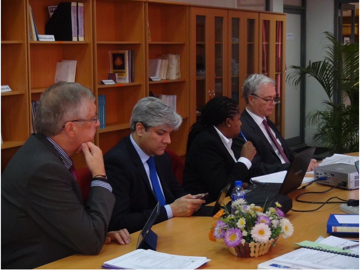
(இலங்கை நீதிபதிகள் நிறுவகத்தில் ஐரோப்பிய யூனியனின் பிரதிநிதிகள்)

ஐரோப்பிய யூனியனின் ஆதரவுடன் கணினிக் குற்றங்கள் மற்றும் இலத்திரனியல் சான்று என்ற தலைப்பில் பல பயிற்சி நிகழ்ச்சிகளை நடாத்துவதற்கு இலங்கை நீதிபதிகள் நிறுவகம் திட்டமிட்டுக் கொண்டிருக்கின்றது என்பதுடன் பூர்வாங்க கலந்துரையாடல் 2014 இல் ஐரோப்பிய யூனியனின் பிரதிநிதிகளுடன் இலங்கை நீதிபதிகள் நிறுவகத்தில் இடம் பெற்றது.