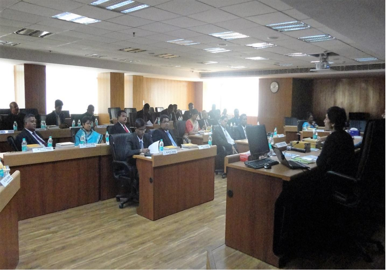
(இந்தியாவின் நியூடெல்லியில் நடாத்தப்பட்ட பயிற்சி நிகழ்ச்சி)