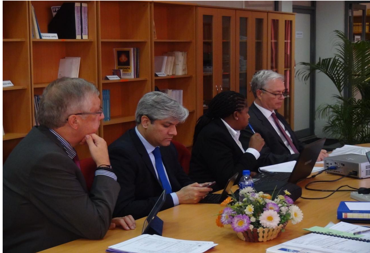
(ශ්‍රී ලංකා විනිශ්චයකාරවරයන්ගේ ආයතනයට පැමිණි යුරෝපා සංගමයේ නියෝජිත මණ්ඩලය )

ශ්‍රී ලංකා විනිශ්චයකාරවරයන්ගේ ආයතනය 2014 නොවැම්බර් මාසයේ දී අධිකරණ පුහුණුව සඳහා වන ජාත්‍යන්තර සංවිධානයේ විධායක කමිටුවේ නිරණය ප්‍රකාරව අධිකරණ පුහුණුව සඳහා වන ජාත්‍යන්තරයේ සාමාජිකත්වය ලබා ගන්නා ලදී. ශ්‍රී ලංකා විනිශ්චයකාරවරයන්ගේ ආයතනය, යුරෝපා සංගමයේ සහාය ඇතිව සයිබර් අපරාධ සහ ඉලෙක්ට්‍රොනික සාක්ෂි පිළිබඳ පුහුණු වැඩසටහන් ගණනාවක් පැවැත්වීමට සැලසුම් කරමින් සිටින අතර, ඒ පිළිබඳ මූලික සාකච්ඡා 2014 වර්ෂයේ දී යුරෝපා සංගමයේ නියෝජිත මණ්ඩලය සමග ශ්‍රී ලංකා විනිශ්චයකාරවරයන්ගේ ආයතනයේ දී පවත්වනු ලැබිණි.