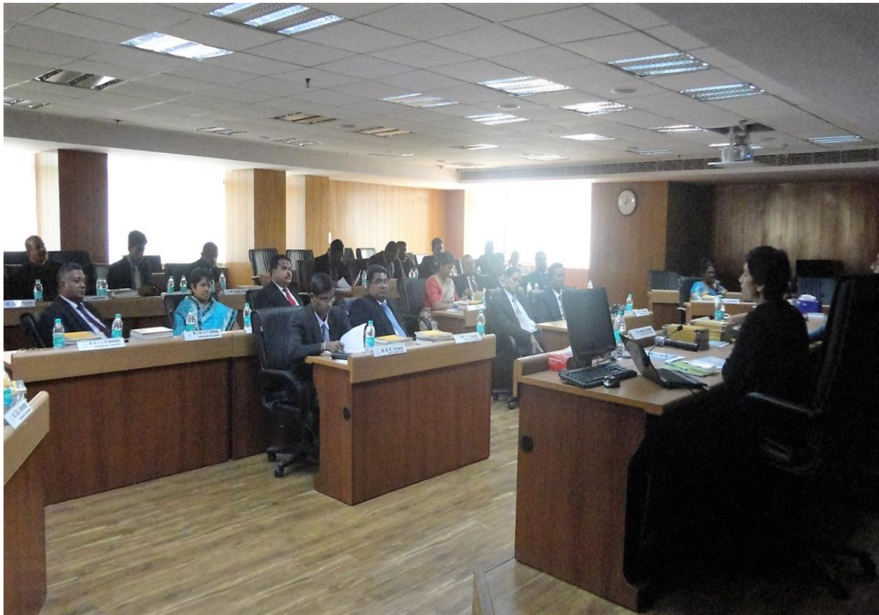
(ඉන්දියාවේ දී ලබා දුන් විදේශීය පුහුණුව)