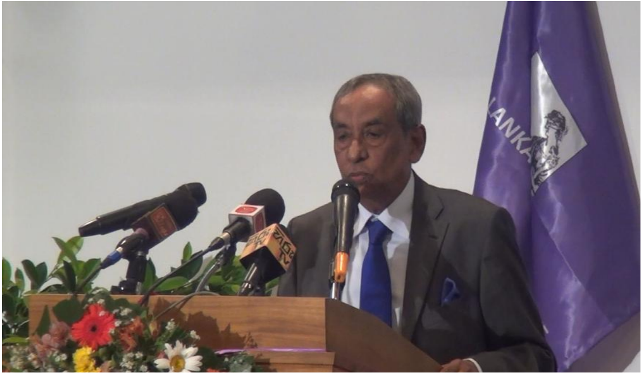
(විනිසුරු ගරු ජේ.එල්.ඒ සෝසා අනුස්මරණ දේශනය ජනාධිපති නීතිඥ ලාසිස් මුස්තාලා මහතා විසින් පවත්වන අයුරු)