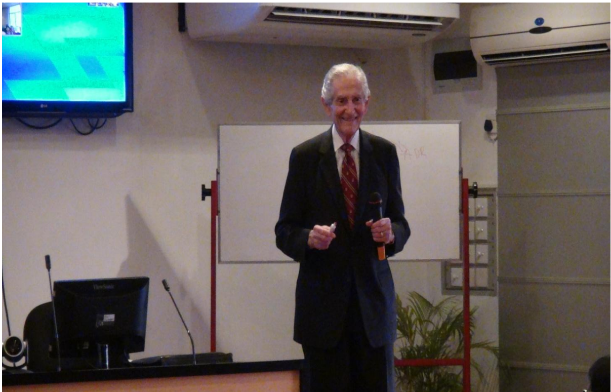
(විනිශ්චයකාර ගරු ක්ලිෆ්ට්ඩ් චොලස් මැතිතුමා ශ්‍රී ලංකා විනිශ්චයකාරවරයන්ගේ ආයතනයේ දී කරුණු ප්‍රදර්ශනය කරමින්)