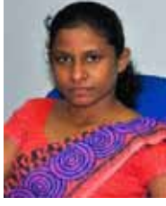
சட்டத் திணைக்களத் தலைவர் (AM)

அம்மணிருகேமஞ்சுளா கு . எல்எல்பீ (LLB) கௌரவப் பட்டம் (கொழும்பு)