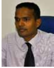
பொது உரிமைக் கோரிக்கைத் திணைக்களத் தலைவர் (AM)