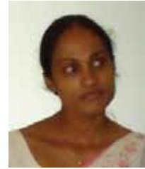
பயிர்க் காப்புறுதித் திணைக்களத் தலைவர் (AM)