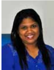
கணக்கீடு மற்றும் நிதி அறிக்கையிடல் பிரிவுத் தலைவர் (AM)