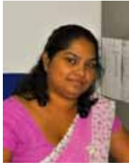
வே.க.சி.கு. & ப (SRCC & Tr) திணைக்களத் தலைவர் (AM)