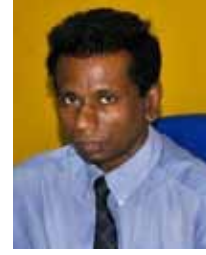
ஆராய்ச்சி மற்றும் பகுப்பாய்வுத் திணைக்களத் தலைவர் (AM)