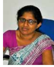
பொது காப்பீட்டுப் பொறுப்பேற்றல் திணைக்களம் மற்றும் அனுவராதபுரக் கிளை தலைவர் (AM)