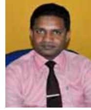
அக்ரஹார திணைக்களத் தலைவர் (AM)