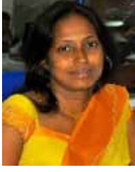
மீள்காப்புறுதிதிணைக்களத் தலைவர் (AM)