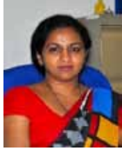
செலவின மற்றும் முதலீட்டுப் பிரிவுத் தலைவர் (AM)