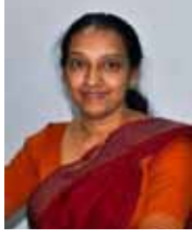
நிதித் திணைக்களத் தலைவர் (M)