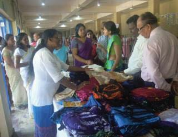
காலி மாவட்ட விற்பனைச் சந்தையின் முக்கிய சில காட்சிகள்