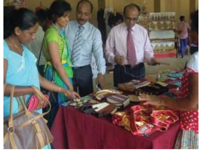
பொலன்னறுவை கைப்பணிக் கைத்தொழில் விற்பனைச் சந்தையின் முக்கிய சில காட்சிகள்