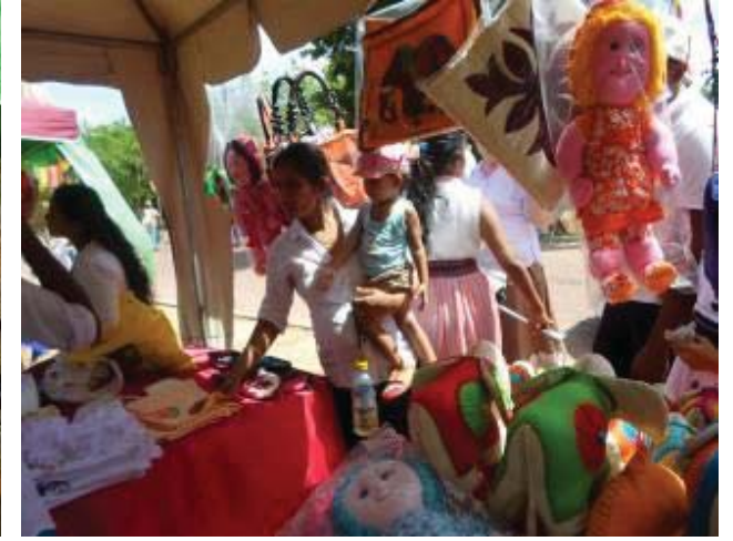
குளியாபிட்டிய கைத்தொழில் விற்பனைச் சந்தையின் முக்கிய சில காட்சிகள்