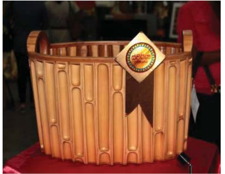
புதிய கைப்பணிக் கைத்தொழில் துறை