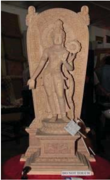
பாரம்பரியக் கைப்பணிக் கைத்தொழில் துறை