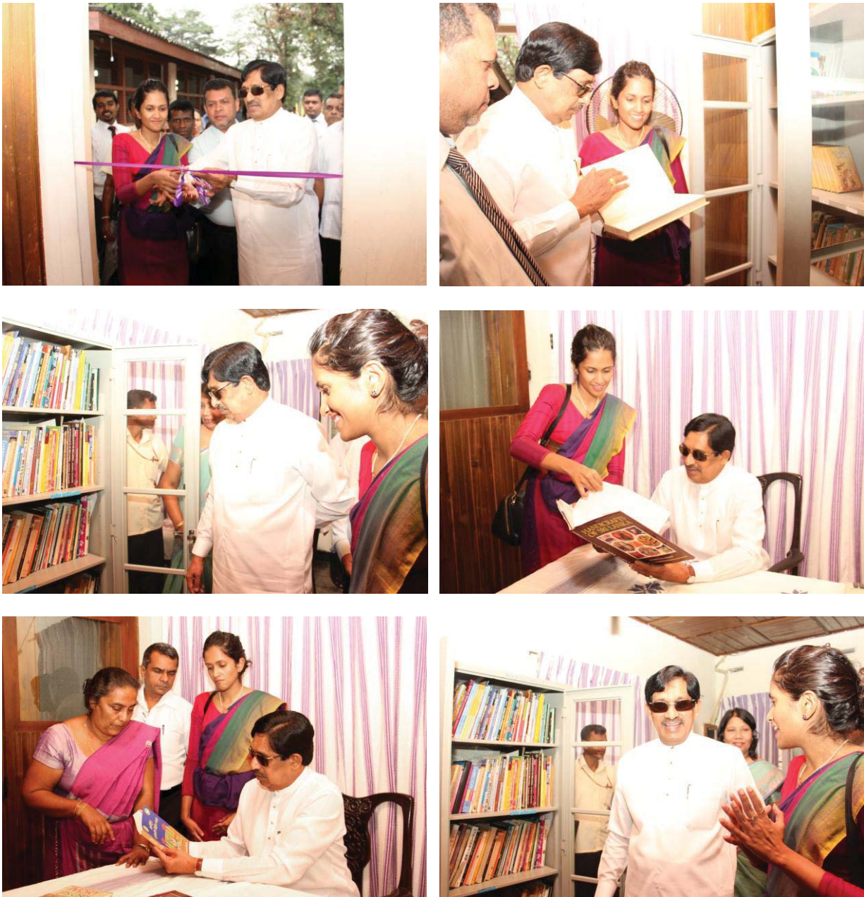
මහනුවර පොල්ගොල්ල නව පුස්තකාලය ස්ථාපිත කිරීමේ විශේෂ අවස්ථා

හස්ත කර්මාන්ත පිළිබඳව පර්යේෂණවල යෙදෙන්නට, අධ්‍යයනය කරන්නට, හස්ත කර්මාන්ත පිළිබඳ උනන්දුවක් දක්වන්නන්ට පරිශීලනය කිරීම සඳහා මෙන්ම පාරම්පරික හස්ත කර්මාන්ත පිළිබඳව සහ ඒවායේ නිෂ්පාදන ක්‍රියාවලියන් පිළිබඳව ඓතිහාසික හා නූතන තොරතුරු ඇතුළත් හස්ත කර්මාන්ත ආශ්‍රිත සහ අනෙකුත් විෂයන් හා සම්බන්ධ පොත් ඇතුළත් නව පුස්තකාලයක් මහනුවර පොල්ගොල්ලෙහි ස්ථාපිත කරන ලදී. කර්මාන්ත හා වාණිජ කටයුතු ගරු රාජ්‍ය අමාත්‍ය වම්පිකා ප්‍රේමදාස මැතිතුමාගේ ප්‍රධානත්වයෙන් 2016 අගෝස්තු 23 දින මෙහි විවෘත කිරීමේ උත්සවය පවත්වන ලදී.