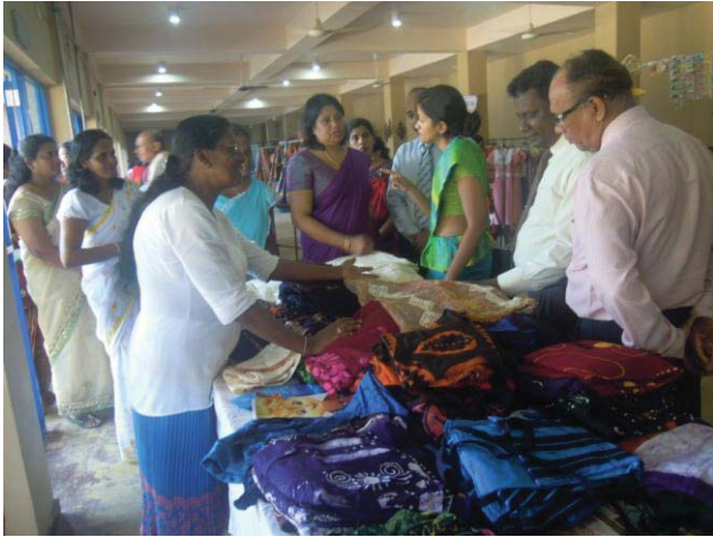
ගාල්ල දිස්ත්‍රික් අලෙවිපොල හි අවස්ථා කිහිපයක්