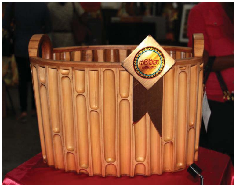
නූතන හස්ත කර්මාන්ත ක්ෂේත්‍රය