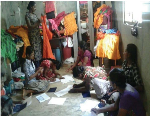
වවනියා දිස්ත්‍රික් - බතික් ගුරු ශිල්පී පුහුණු වැඩසටහන