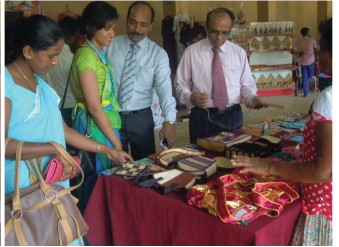
පොළොන්නරුව හස්ත කර්මාන්ත අලෙවිපොල හි අවස්ථා කිහිපයක්