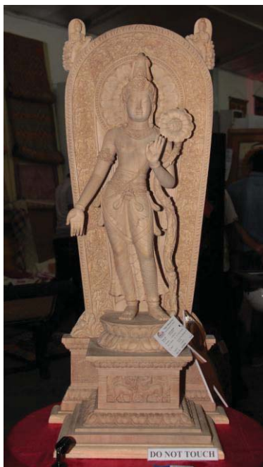
සාම්ප්‍රදායික හස්ත කර්මාන්ත ක්ෂේත්‍රය