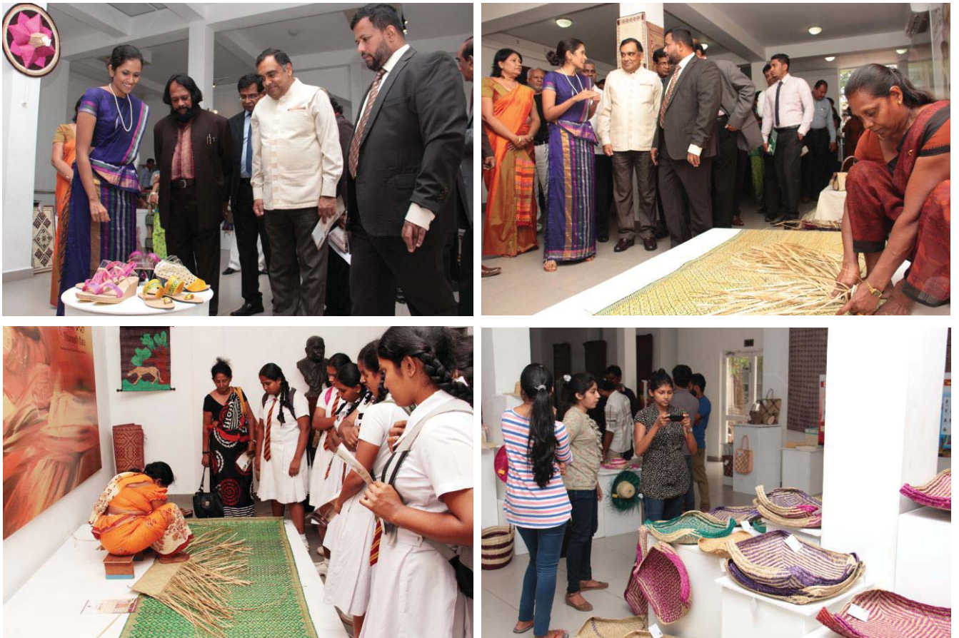
තුන්පත් රටා ප්‍රදර්ශනයේ අවස්ථා කිහිපයක්