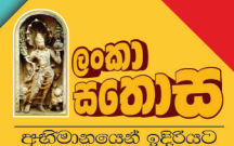
නලින් ප්‍රනාන්දු සභාපති

අවසාන වශයෙන් ආයතනයේ ප්‍රගතිය සඳහා අධ්‍යක්ෂ මණ්ඩලය ලබාදෙන දායකත්වය පිළිබඳව මගේ හෘද්‍යාංගම කෘතඥතාව එලකිරීමට මෙය අවස්ථාවක් කරගනිමි. එමෙන්ම කළමනාකරණ කණ්ඩායම, සෑම මට්ටමකම කාර්ය මණ්ඩලය, අපේ සැපයුම්කරුන් හා ලංකා සතොස ආයතනයට කවදත් අනුග්‍රහය දක්වන වටිනා පාරිභෝගිකයින්ටද මගේ අවංක ස්තූතිය හිමි වේ.