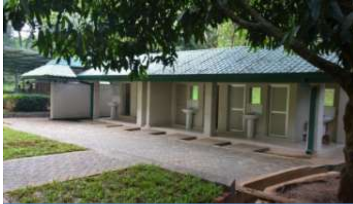
நவீன மயப்படுத்தப்பட்ட கழியலறை கட்டிடத்தொகுதி