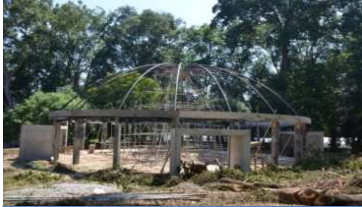
பேராதனை தாவரவியல் பூங்காவில் நிர்மாணிக்கப்படும் தாவர இல்லம்