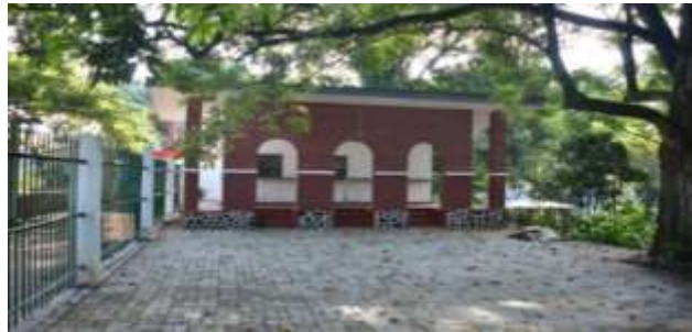
0 கண்ணொருவ நுழைவுச் சீட்டு கருமபீடம்