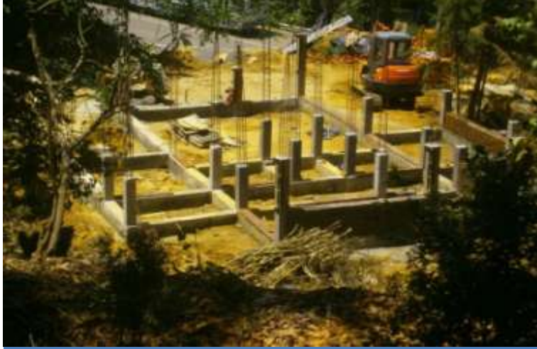
ஹக்கல பூந்தோட்டத்தில் நிர்மாணிக்கப்பட்டு வருகின்ற புதிய பிரவேச கட்டிடத்தொகுதி