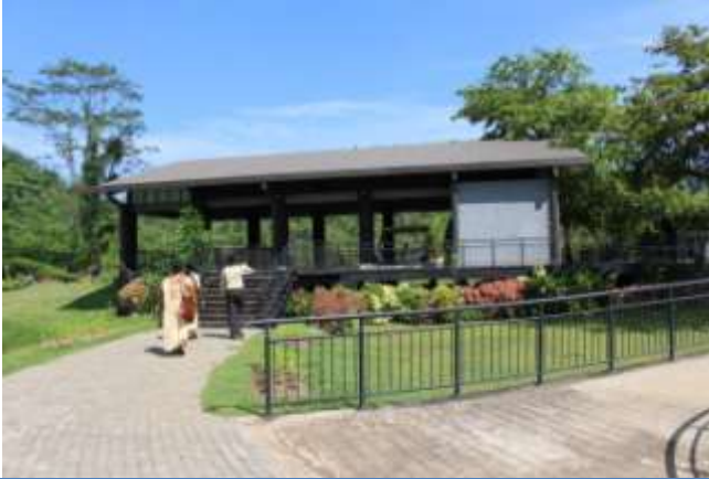
அவிசாவலை தாவரவியல் பூங்காவின் நிர்மாணிப்பு நிறைவு செய்யப்பட்ட வேலி மற்றும் நுழைவாயில்