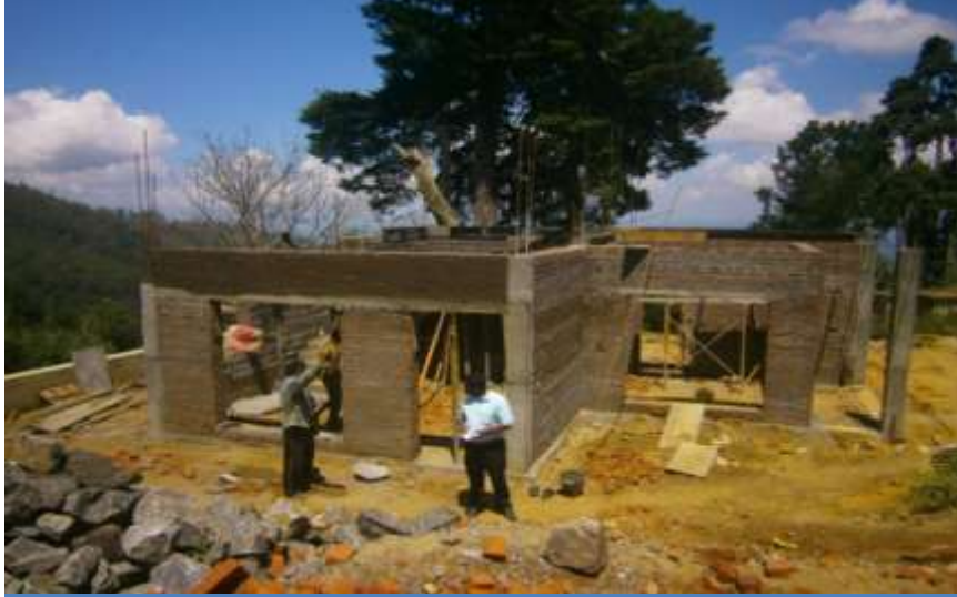
ஹக்கல தாவரவியல் பூங்காவின் நிர்மாணிக்கப்பட்டு வரும் பதவியணி உத்தியோக பூர்வ இல்லங்கள்