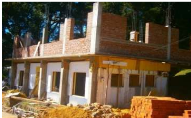
ஹக்கல தாவரவியல் பூங்காவில் நிர்மாணிக்கப்பட்டு வரும் புதிய அலுவலகக் கட்டிடம்