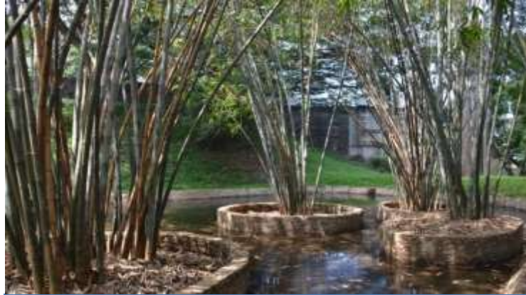
ரோயல் தாவரவியற் பூங்காவில் புதிதாக நிர்மாணிக்கப்பட்ட பூப் பொய்கை