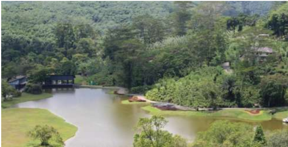
அவிசாவலை தாவரவியல் பூங்காவின் பொய்கை மற்றும் சுற்றுச் சூழல்.