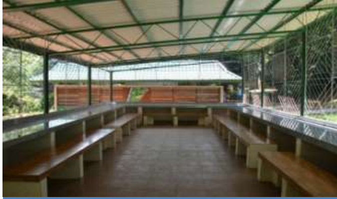
நவீன மயப்படுத்தப்பட்ட உணவு சாப்பிடும் மண்டபம்