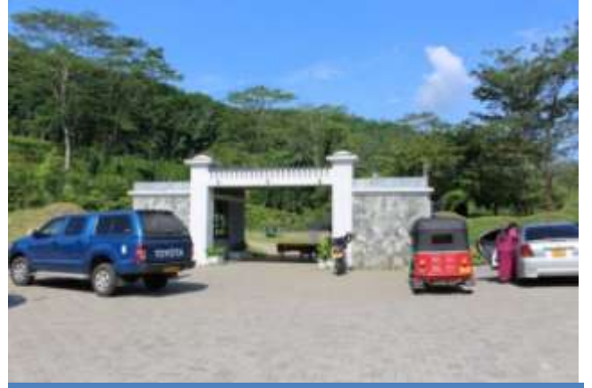
அவிசாவலை தாவரவியல் பூங்காவின் நிர்மாணிப்பு நிறைவு செய்யப்பட்ட வாகனங்கள் தரித்து வைக்கும் இடம்.