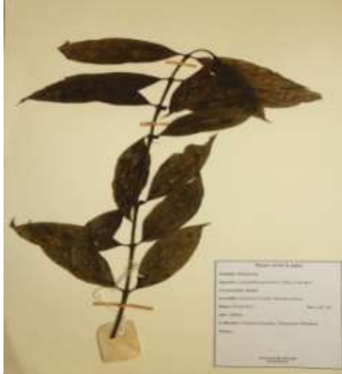
சேகரிக்கப்பட்ட தாவர மாதிரியொன்று