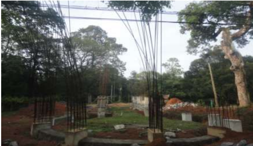
கம்பஹா தாவரவியல் பூங்காவின் நிர்மாணிப்பு செய்யப்பட்டு வருகின்ற ஒக்கிட் தாவர இல்லம்

பார்வையாளர்களுக்கு ஒக்கீட்ஸ் பூ பயிர்ச் செய்கை தொடர்பான அறிவினை வழங்குவதனை இலக்காகக் கொண்டு அந்த விடயங்கள் தொடர்பாக பயன்படுத்திக் கொள்ளும் பொருட்டு அந்தூரிய நாற்றுக்கள் ஷரூ. 21.3 மில்லியன்கள் செலவில் நிர்மாணிப்பதற்கு ஆரம்பிக்கப்பட்டுள்ளதுடன், இந்த நிர்மாணிப்பு அரசு பொறியியல் கூட்டுத்தாபனத்தினால் மேற்கொள்ளப்பட்டு வருகின்றது.