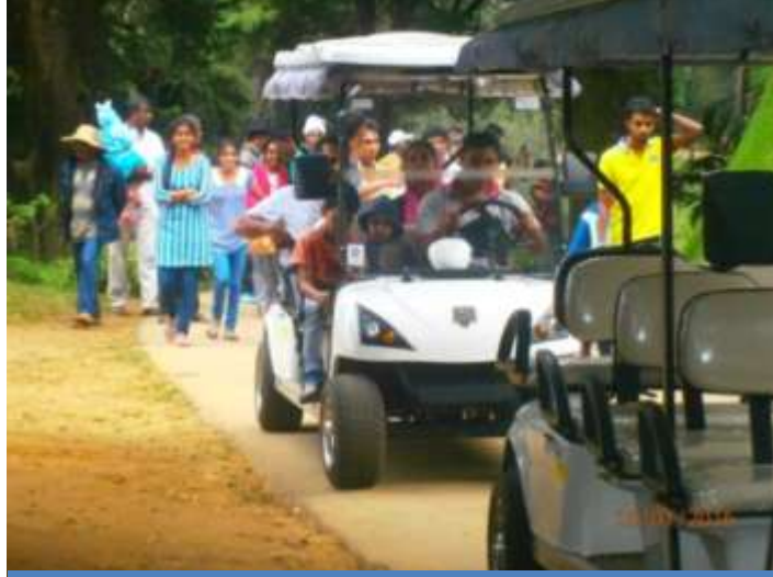
கொள்வனவு செய்யப்பட்ட பற்றறிக்கார்க் ஒன்று பார்வையாளர்களுடன் ஹக்கல தாவரவியற் பூங்காவில்