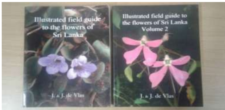
கொள்வனவு செய்யப்பட்ட 2 புத்தகங்கள்