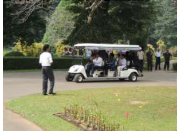
கொள்வனவு செய்யப்பட்ட பற்றறிக்கார்க் ஒன்று பார்வையாளர்களுடன் பேராதெனிய தாவரவியற் பூங்காவில்