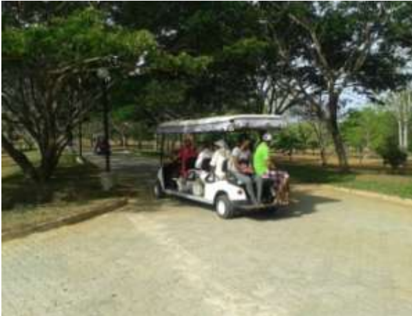
கொள்வனவு செய்யப்பட்ட பெற்றறிக்கார்க் வாகனம் ஹம்மாந்தோட்டை பூங்காவினை பார்வை பார்வையிடும் வேளை