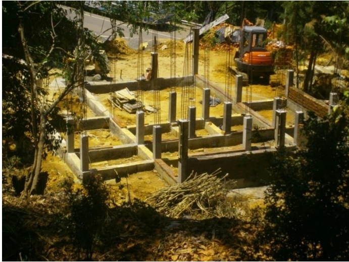
හක්ගල උද්භිද උද්‍යානයේ ඉදිකරමින් පවතින නව පිවිසුම් ගොඩනැගිල්ල