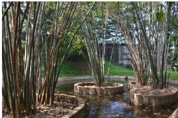
පේරාදෙණිය රාජකීය උද්භිද උද්‍යානයේ අලුතින් ඉදිකරන ලද පොකුණ