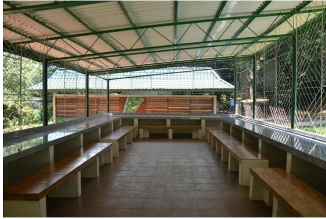
ජේරාදෙණිය රාජකීය උද්භිද උද්‍යානයේ නවීකරණය කරන ලද ආහාර ගැනීමේ ශාලා