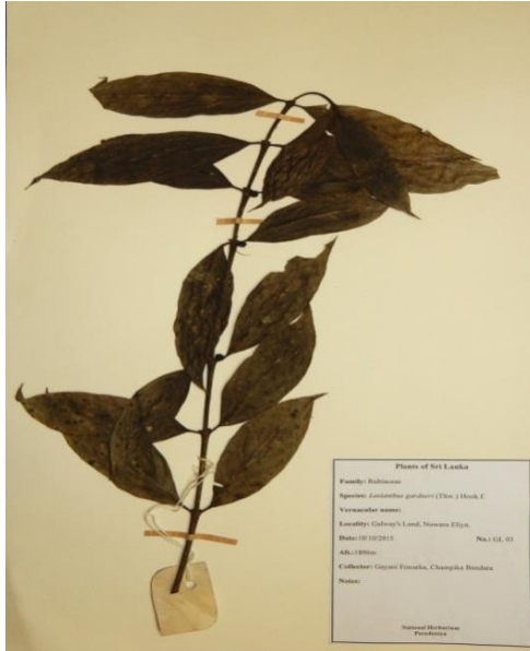
එකතු කල ශාකයක නිදර්ශකයක්