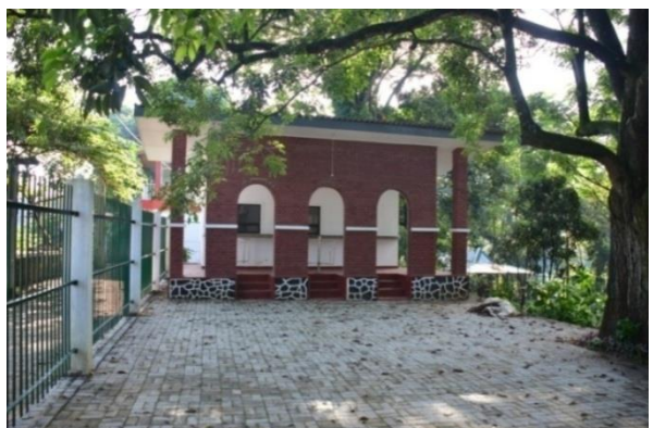
ජේරාදෙණිය රාජකීය උද්භිද උද්‍යානයේ ගන්නොරුව ප්‍රවේශ පත්‍ර කවුළුව