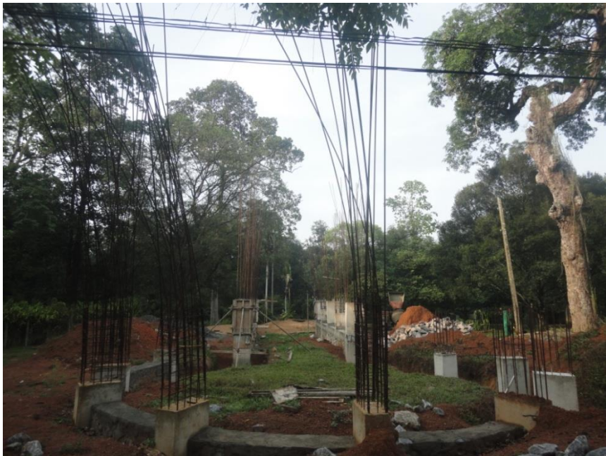
ගම්පහ උද්භිද උද්‍යානයේ ඉදිකරමින් පවතින උඩවැඩියා පැල ගෘහයේ දර්ශනය