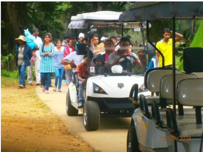
මිලදී ගත් බැටරි කාර් රථයක් හක්ගල උද්භිද උද්‍යානයේ නරඹන්නන් සමඟ

▶ උද්භිද උද්‍යාන තුළ නරඹන්නන්ට පහසුකම් සැලසීම යටතේ උද්‍යාන තුළ නරඹන්නන්ට ගමන් පහසුකම් සලසනු වස් බැටරි කාර් ආසන 08 කාර් 05 ක් සහ ආසන 04 කාර් 05 ක් මිලදී ගන්නා ලදී. බැටරි කාර් යෙදවීම තුළින් අරමුදලේ අමතර ආදායම් උපයීමද වර්ධනාත්මක ලෙසින් වැඩි වී ඇත. ඒ අනුව 2015 වර්ෂයේ බැටරි කාර් ආදායමින් රු.මි 9.00 ක් අරමුදල උපයා ඇත. මෙම කාර් ජේරාදෙණිය රාජකීය උද්භිද උද්‍යානය, හක්ගල උද්භිද උද්‍යානය, ගම්පහ උද්භිද උද්‍යානය, අවිස්සාවේල්ල උද්භිද උද්‍යානය සහ හම්බන්තොට උද්භිද උද්‍යාන වල නරඹන්නන්ගේ පහසුව සඳහා ධාවනයට යොදා ඇත.