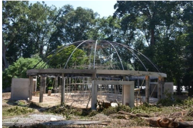
පේරාදෙණිය රාජකීය උද්භිද උද්‍යානයේ ඉදිකරන පැල ගෘහය