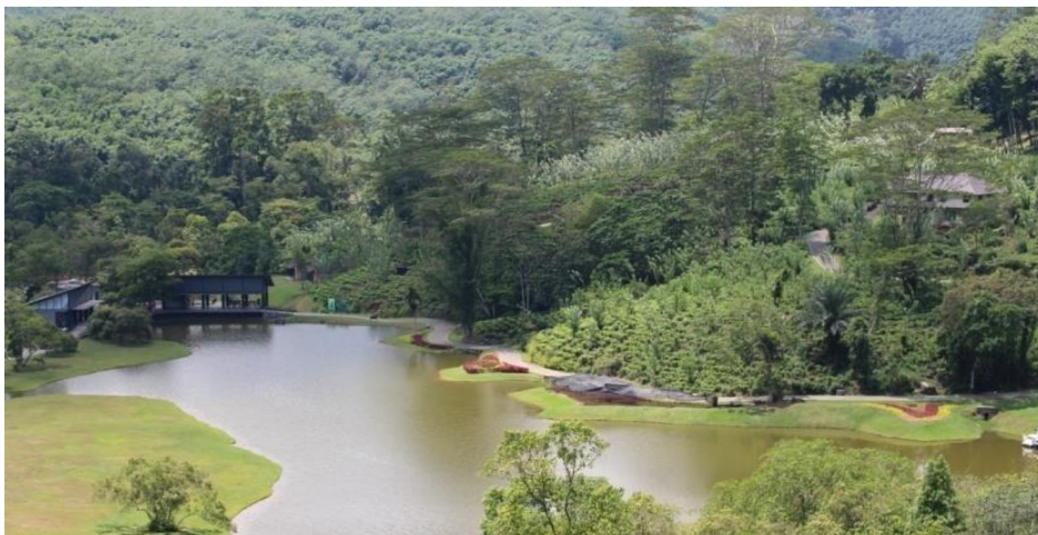
අවිස්සාවේල්ල සීතාවක තෙත් කලාපීය උද්භිද උද්‍යානයේ වැව සහ අවට දර්ශනයක්