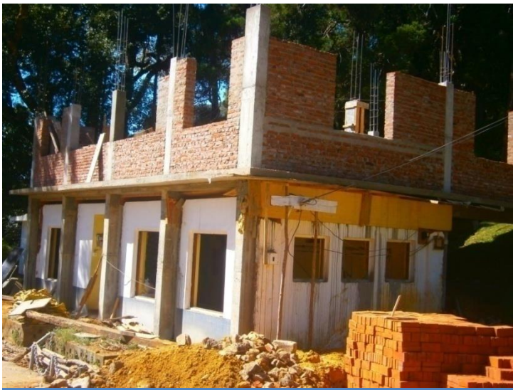
හක්ගල උද්භිද උද්‍යානයේ ඉදිකරමින් පවතින කාර්යාල ගොඩනැගිල්ලේ දර්ශනය