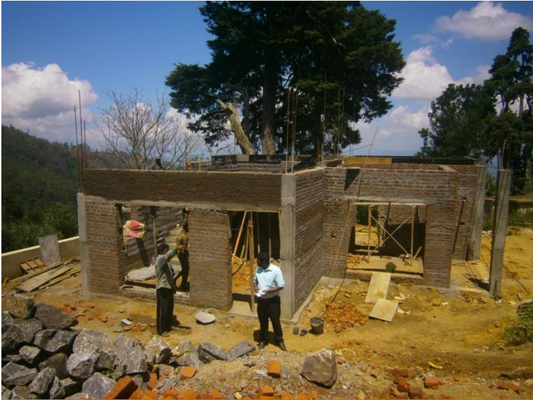
හක්ගල උද්භිද උද්‍යානයේ ඉදිකරමින් පවතින කාර්ය මණ්ඩල නිල නිවාසය