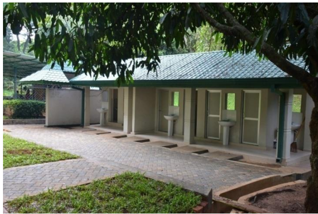
ජේරාදෙණිය රාජකීය උද්භිද උද්‍යානයේ නවීකරණය කරන ලද වැසිකිළි ගොඩනැගිල්ල