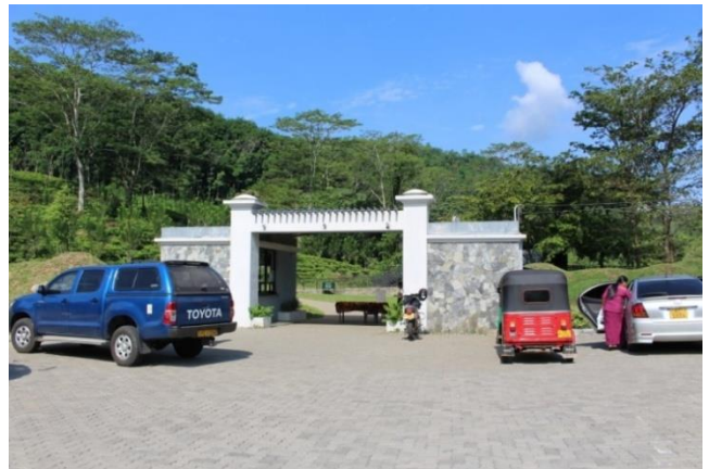
අවිස්සාවේල්ල සීතාවක තෙත් කලාපීය උද්භිද උද්‍යානයේ ඉදිකිරීම් අවසන් කල රථවාහන නැවතුම්පල