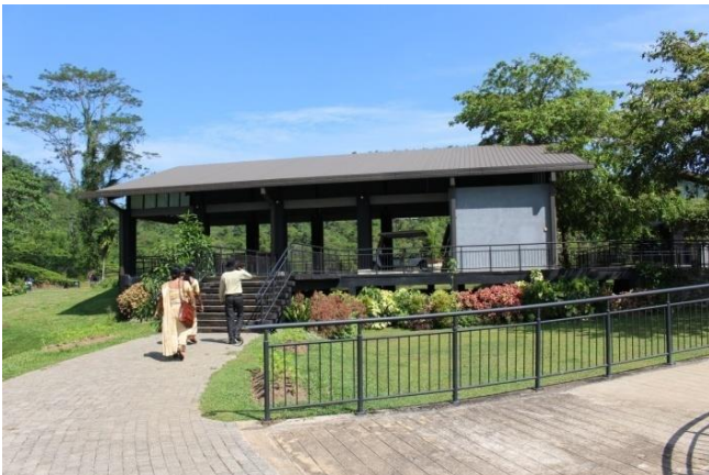
අවිස්සාවේල්ල සීතාවක තෙත් කලාපීය උද්භිද උද්‍යානයේ ඉදිකිරීම් අවසන් කල වැට සහ පිවිසුම් දොරටුව (ගේට්ටුව)