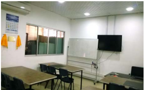
නවීකරණය කරන ලද වාහන ඉලෙක්ට්‍රොනික් පුහුණු අංශය(AETS)