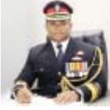
குஷான் சம்பத் ஜயரத்ன பிரதிப் படைக்கலச் சேவிதர்