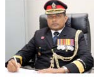
அசிந்த சிறிமல் கூரே உதவிப் படைக்கலச் சேவிதர்