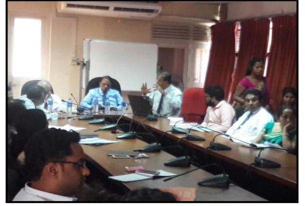
பேராசிரியர் ஸ்ரீ.ஹெட்டிஹே சமூகவியல் திணைக்களம் கொழும்பு பல்கலைக்கழகம்