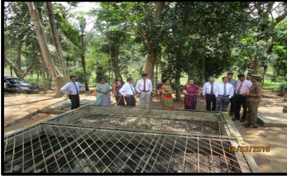
பௌதீக வாயு அலகு – பல்லேகல