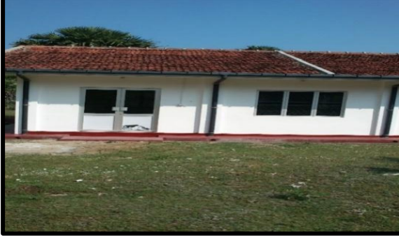
பெறுமதி சேர் செய்முறை அலகு உருவாக்கல் மற்றும் செயல் விளக்கம்